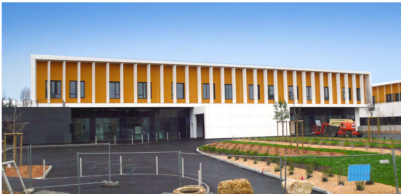
Entrée Est - Urgences cardio-vasculaire