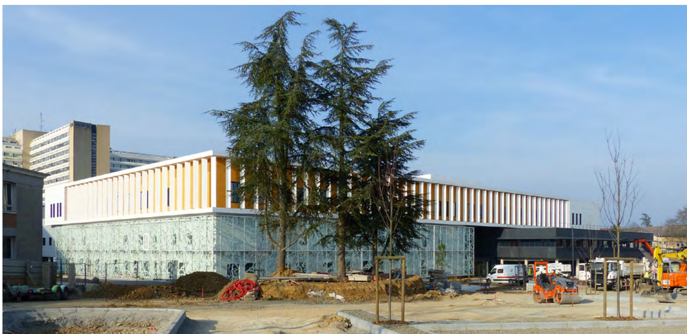
Façades Ouest et Sud