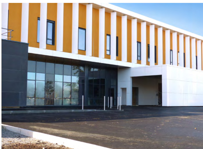
Entrée des Urgences