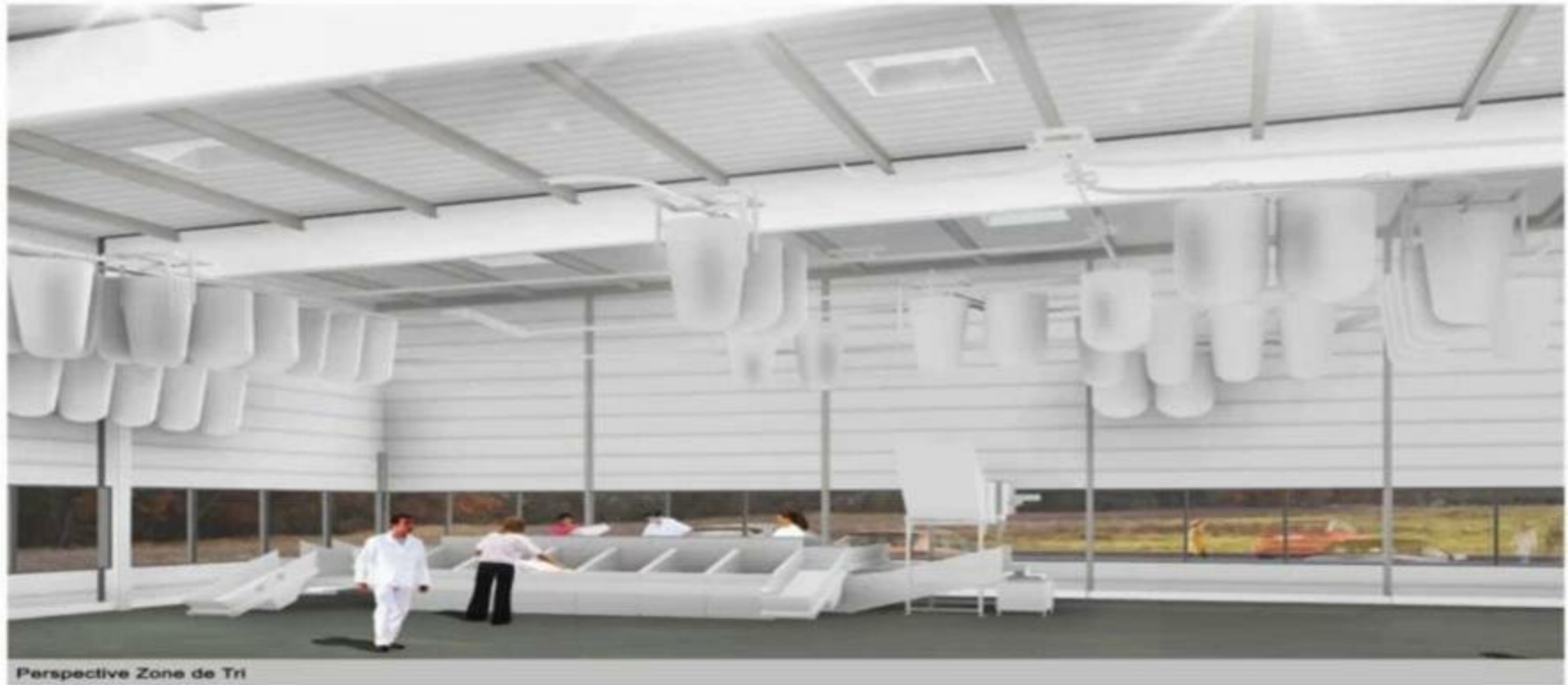
Perspective Zone de Tri