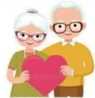
Atelier Linge Résidents