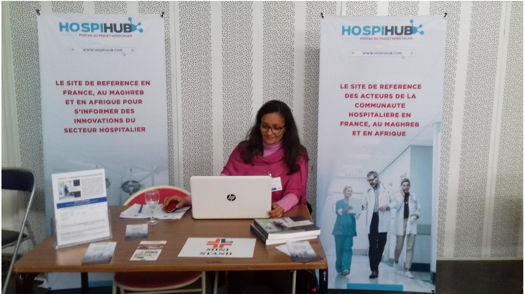
Notre partenaire HOSPIHUB