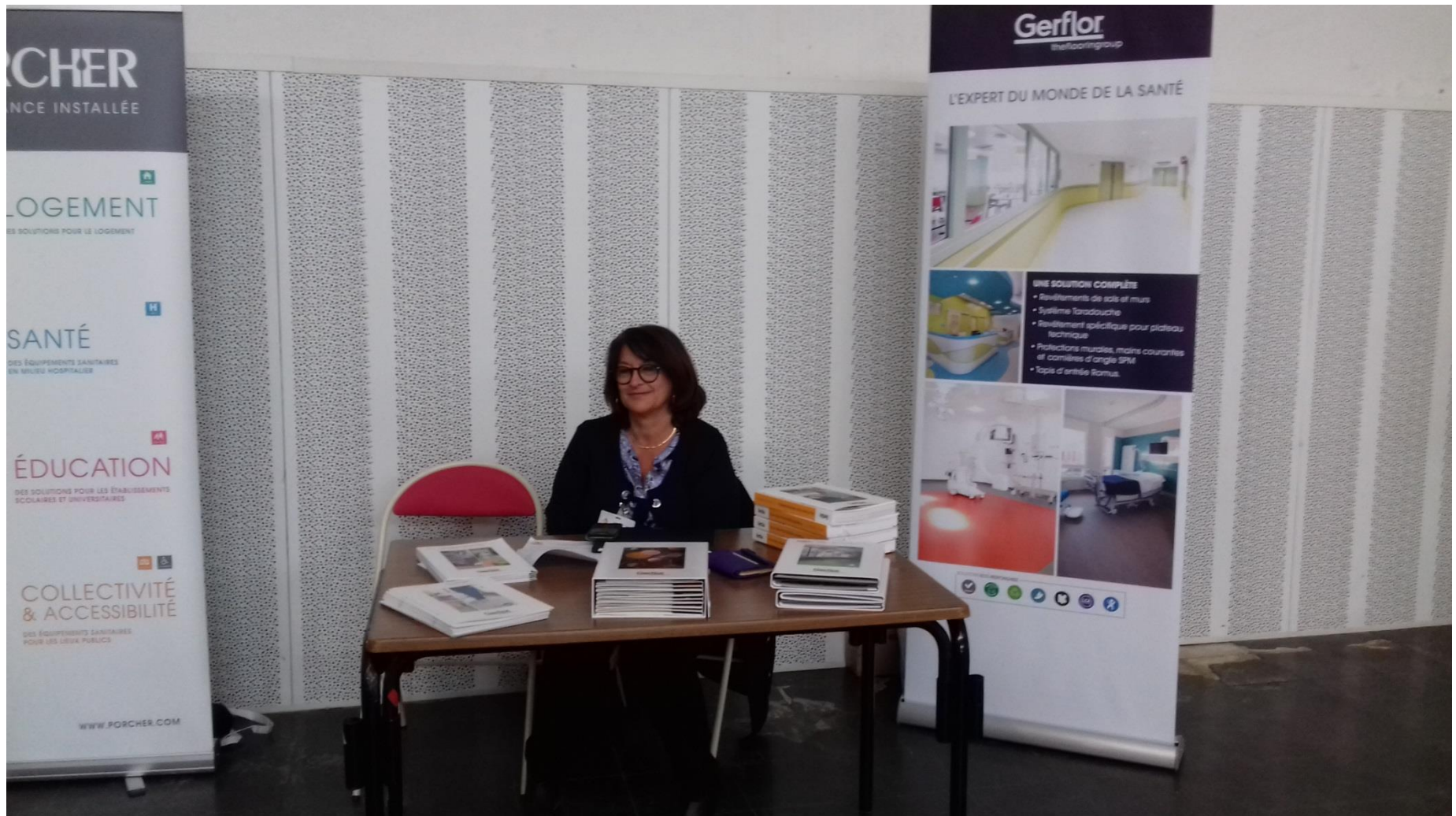
Notre partenaire GERFLOR