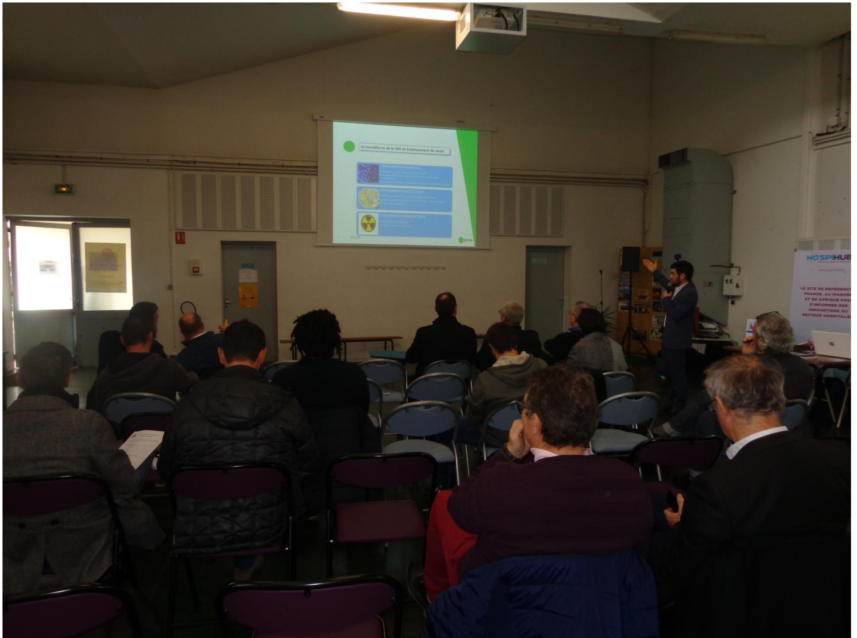
L'audience avec l'APAVE