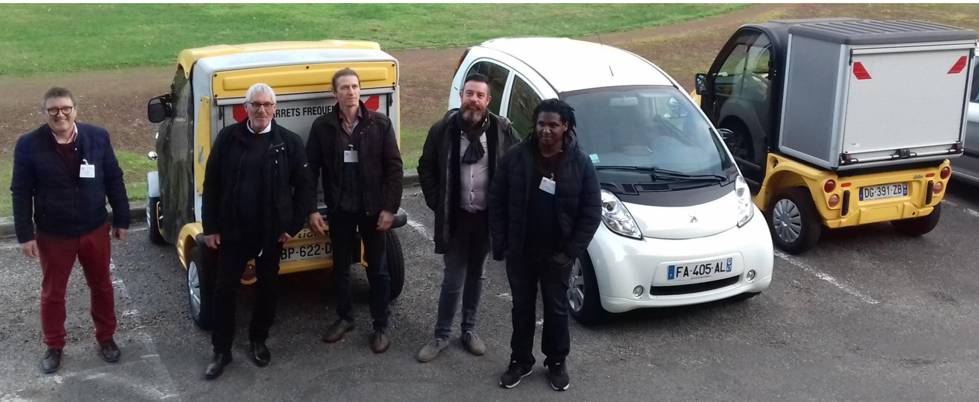
les derniers participants devant 3 des 5 véhicules électriques